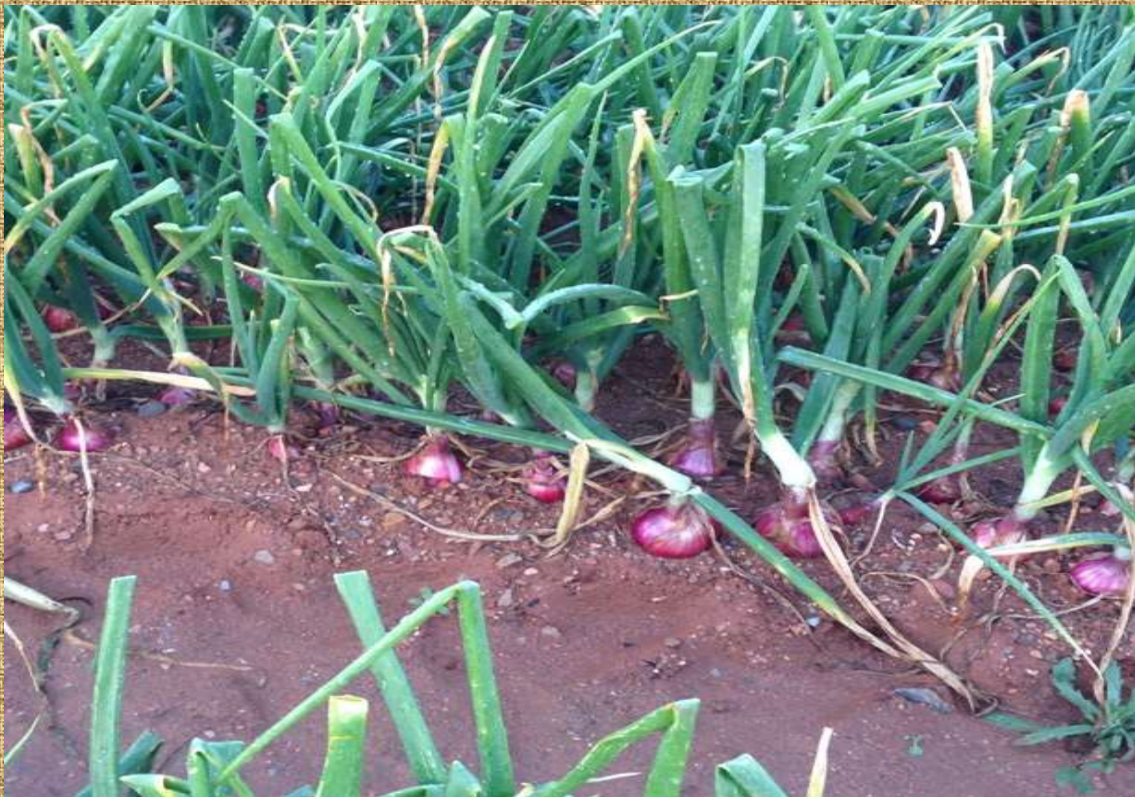
Βολβοποίηση ανοιξιάτικου κρεμμυδιού