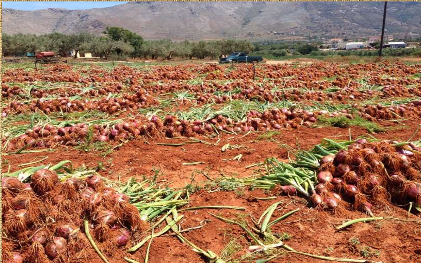
Συγκομιδή κρεμμυδιών Μάιος 2018